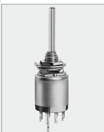
einpolig 9032.0100 8 7 x 45°