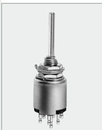
einpolig 9030.0100 6 5 x 60°